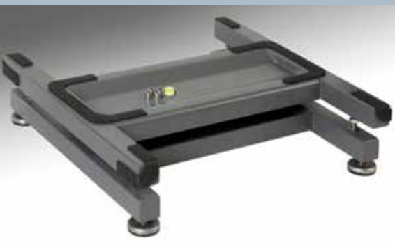
Particolare della struttura interna Internal structure

WEIGHING PLANE FOR INDUSTRIAL AND COMMERCIAL APPLICATIONS